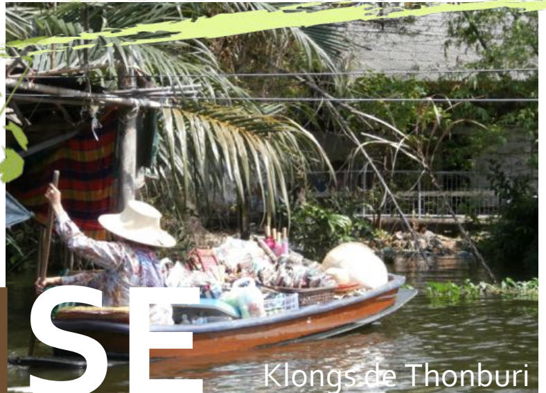
Klongs de Thonburi